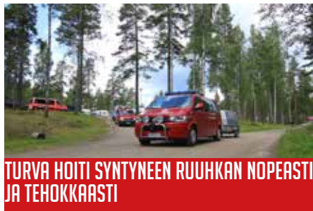
TURVA HOITI SYNTYNEEN RUUHKAN NOPEASTI JA TEHOKKAASTI