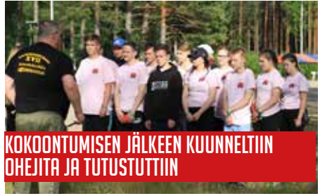
KOKOONTUMISEN JÄLKEEN KUUNNELTIIN OHEJITA JA TUTUSTUTTIIN