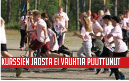
KURSSIEN JAOSTA EI VAUHTIA PUUTTUNUT