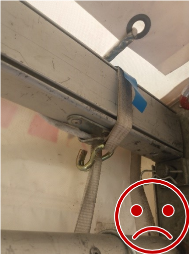
Kuormaliina leikkaantuu kiristyessään.