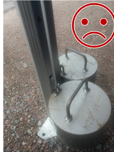
Painojen teräskoukku ei ole lukittu. Teräs leikkaa alumiinia, jolloin kiinnitys ei ole toimiva.